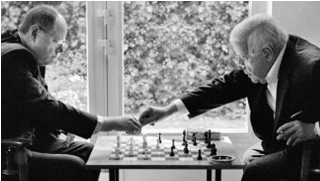
Steinbrueck,Peer – Schmidt,Helmut Zug um Zug – Buchcover Hamburg, 10.2011